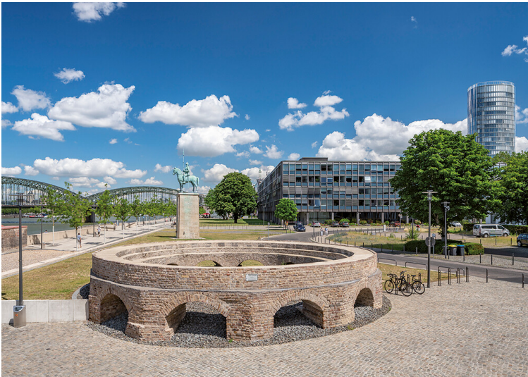
Kennedy-Ufer in Deutz (2020)