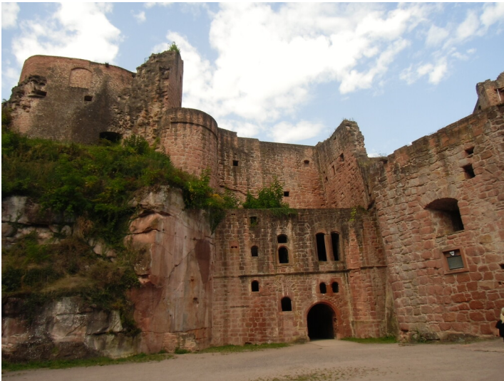
Bastionsturm und Verbindungsbau (2021)