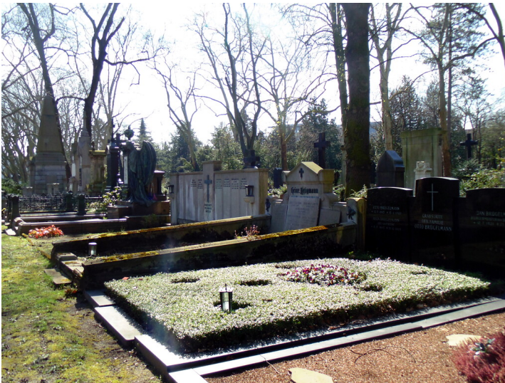
Blick von Norden auf die Grabstätte der Unternehmerfamilie Brügelmann auf dem Melatenfriedhof in Köln-Lindenthal, in dem auch der ehemalige Kölner Oberbürgermeister Jan Brügelmann seine letzte Ruhestätte fand (2020).