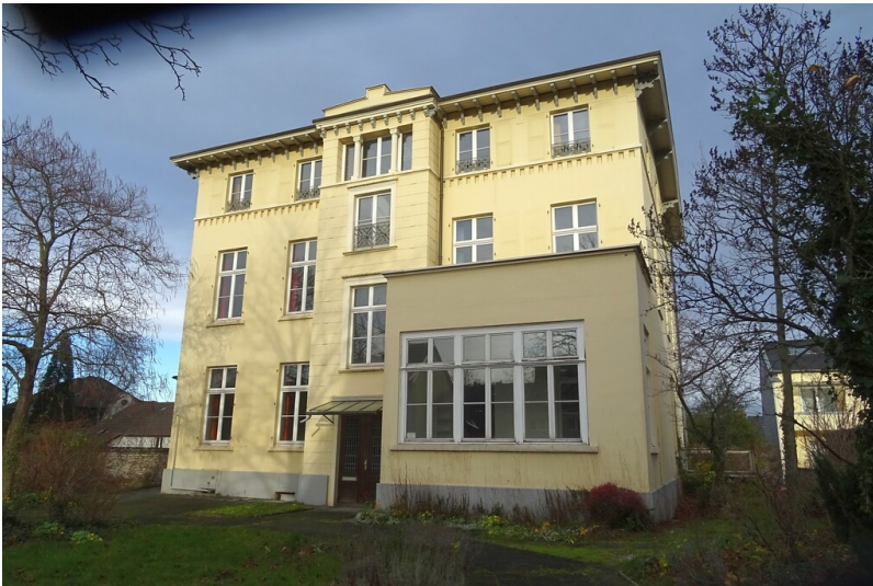
Villa Richarz in Bonn-Endenich (2017)