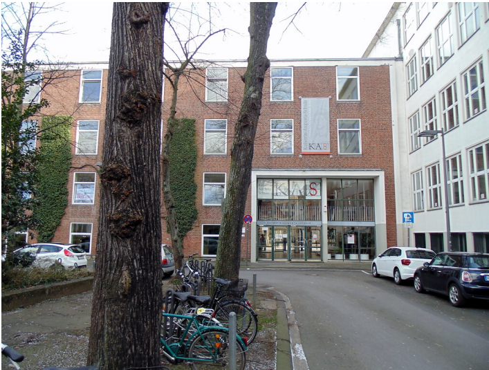
Blick von Westen aus auf die Kaiserin-Augusta-Schule (KAS) am Georgsplatz in Köln-Altstadt/Süd (2021).