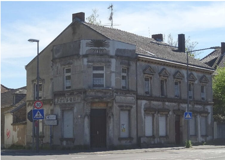
Wohnhaus Hauptstraße 352 in Porz (2020)