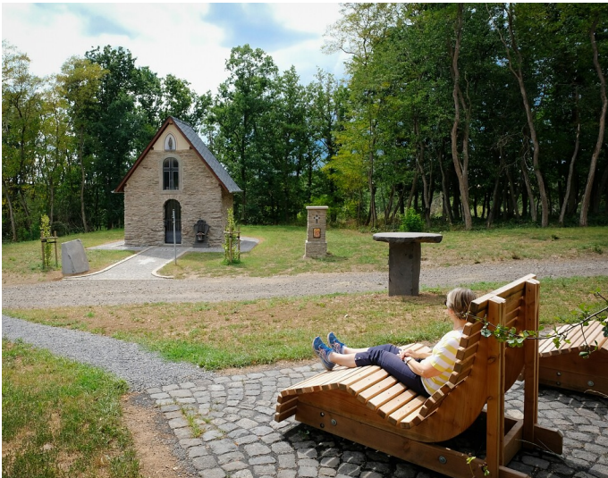
Die Kapelle „Allebrauns Heiligenhäuschen“ westlich von Naunheim nach ihrer Renovierung (Juli 2022).