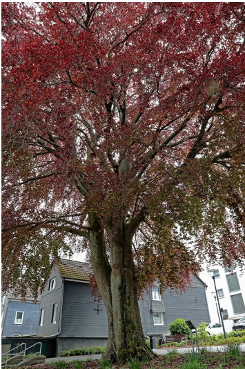
Blutbuche im Park Nowy Targ (2020)