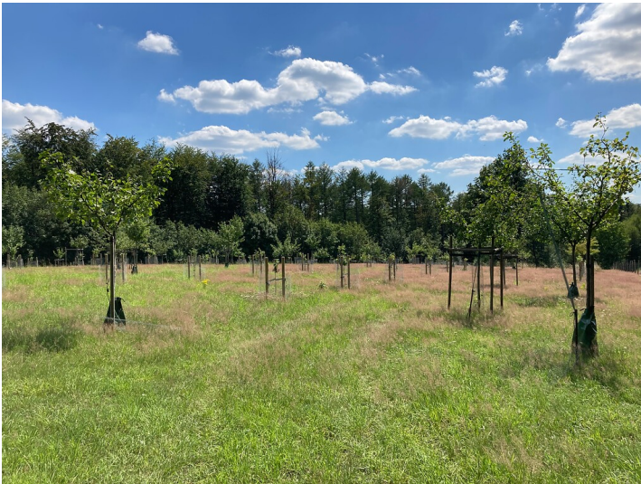
Streuobstwiese Sellscheid (2020)