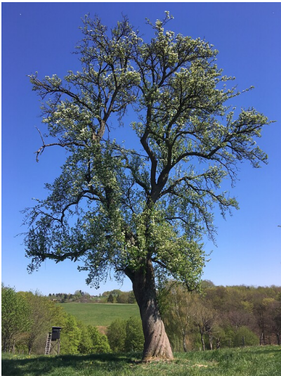
Naturdenkmal Einzelbaum Birne östlich von Mittelberg (2020)