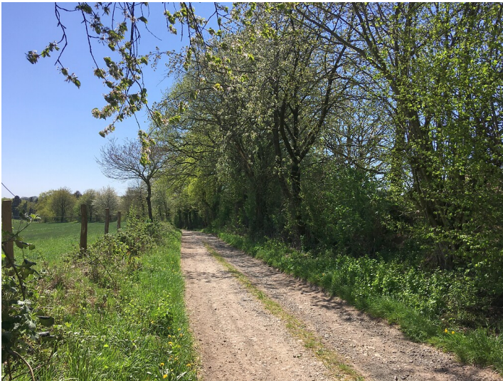
Hohlwegabschnitte östlich Oberberg und Unterberg (2020)