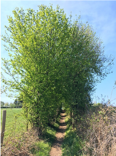
Hohlweg südwestlich von Großfrenkhausen (2020)