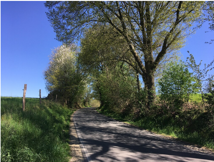
Hohlweg an der Kreisstraße 15 zwischen Emminghausen und Dabringhausen (2020)