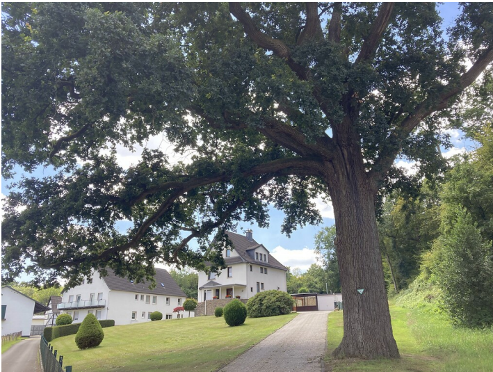
Naturdenkmal Stieleiche dem Hofgelände Eicherhof in Scharrenbroich (2020)