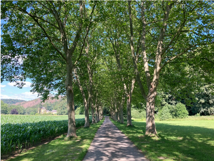
Platanenallee nördlich von Odenthal (2020)