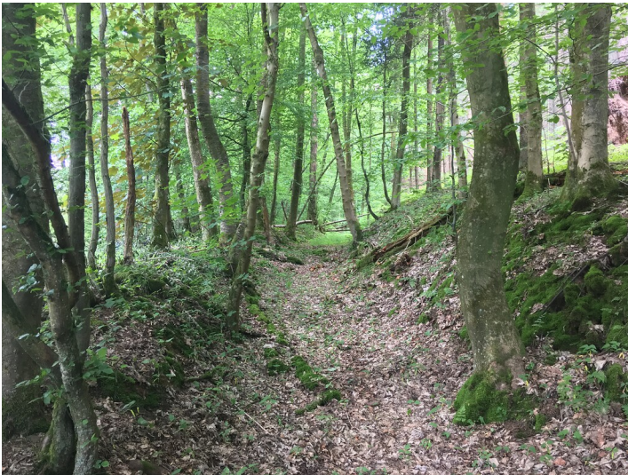
Hohlwegrelikte im Pfengstbachtal (2019)