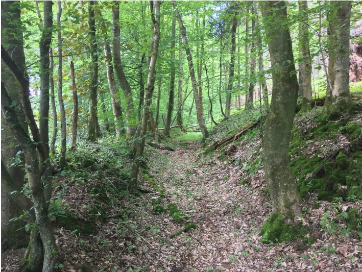
Hohlwegrelikte im Pfengstbachtal (2019)