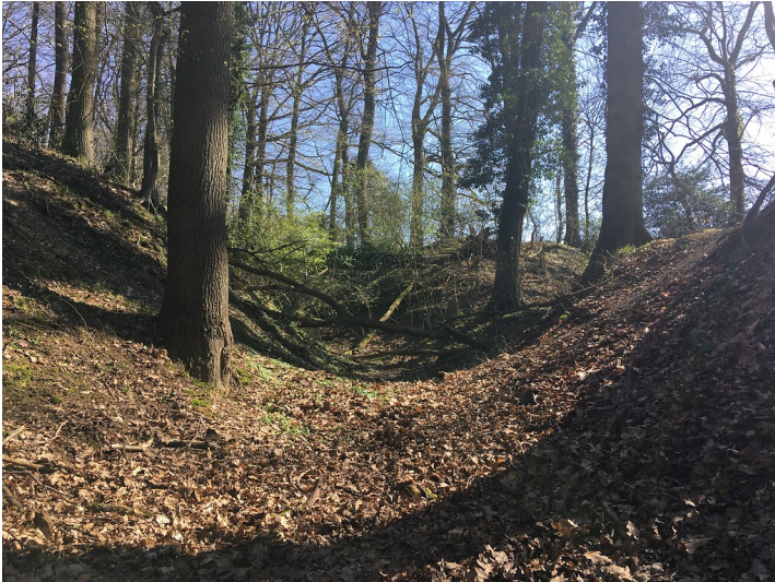
Hohlweg Fuchskaule (2020)