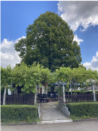
Alte Winterlinde in Eikamp (2020)