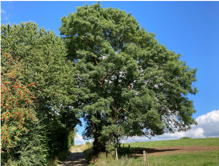
Vierstämmige Schwarzesche südöstlich von Oberbersten (2020)