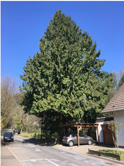
Naturdenkmal Lebensbaum nördlich von Olpe (2020)