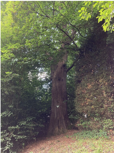
Naturdenkmal Esskastanie am Wiedenhof nördlich von Olpe (2020)