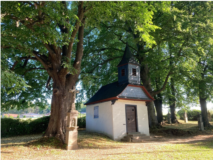
Naturdenkmal Baumgruppe an der St. Jakobus-Kapelle in Spitze (2020)