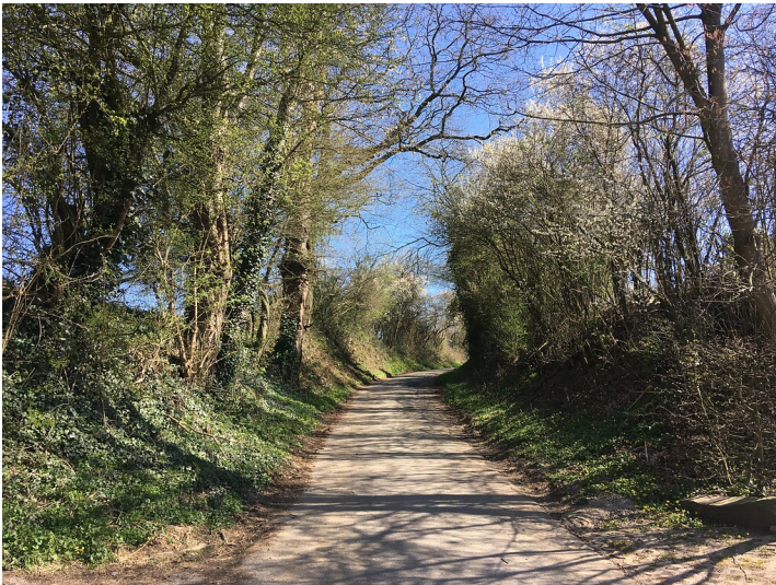
Hohlweg mit Gehölzbestand nordöstlich Sülze (2020)