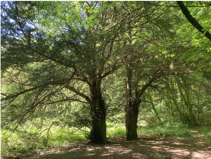
Naturdenkmal Zwei Eiben am Bökershammer (2020)