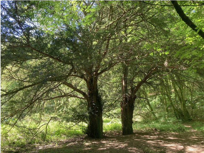
Naturdenkmal Zwei Eiben am Bökershammer (2020)