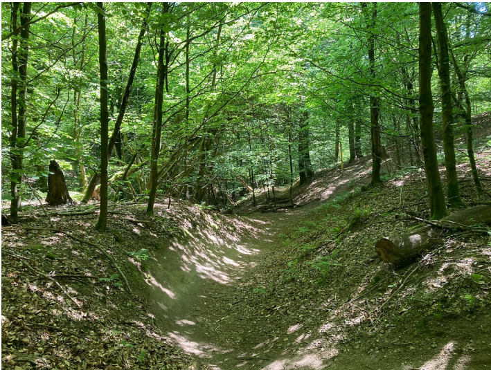
Hohlweg zwischen Kaltenherberg und Bökershammer (2020)