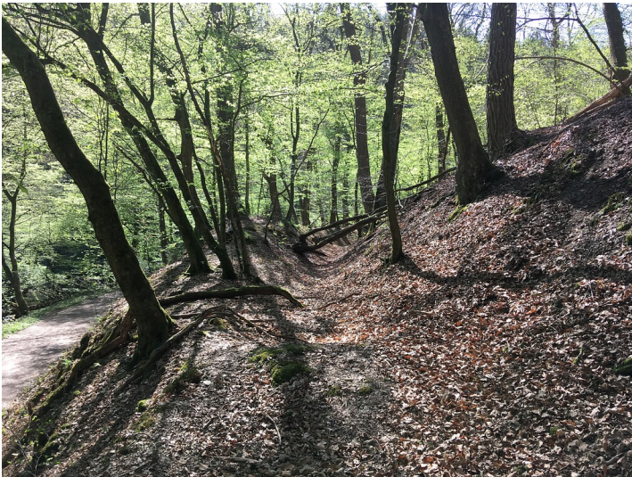
Hohlwegrelikt im Eifgenbachtal (2020)