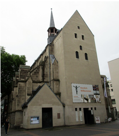
Blick auf die evangelische "AntoniterCityKirche", die frühere Antoniter-Klosterkirche in der Kölner Schildergasse in Altstadt-Nord (2020).