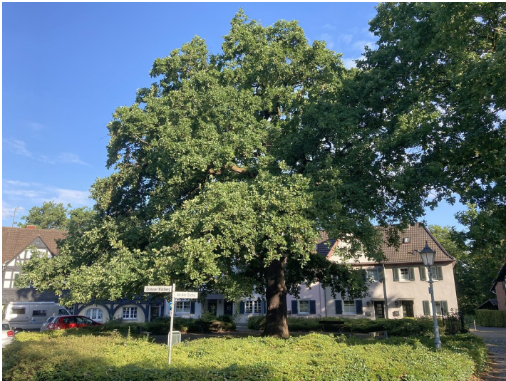
Naturdenkmal Stieleiche auf dem Eichplatz Gronauer Wald (2020)