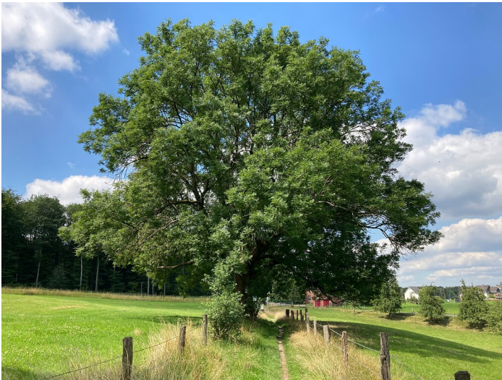
Naturdenkmal Eschen bei Breite (2020)