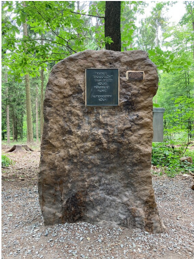
Monte Troodelöh im Königsforst (2020)