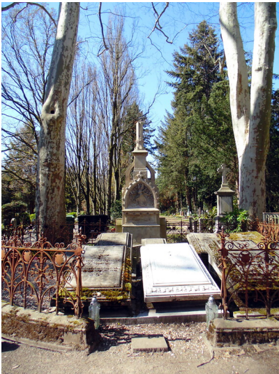
Die Grabstätte der aus dem Kölner Patriziat stammenden Familie von Wittgenstein auf dem Melatenfriedhof in Köln-Lindenthal (2020).