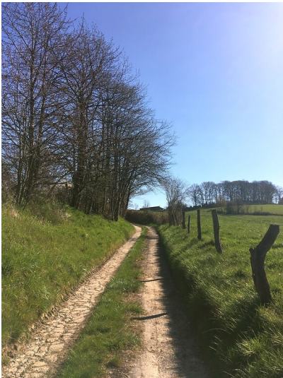
Hohlweg südöstlich von Asselborn (2020)