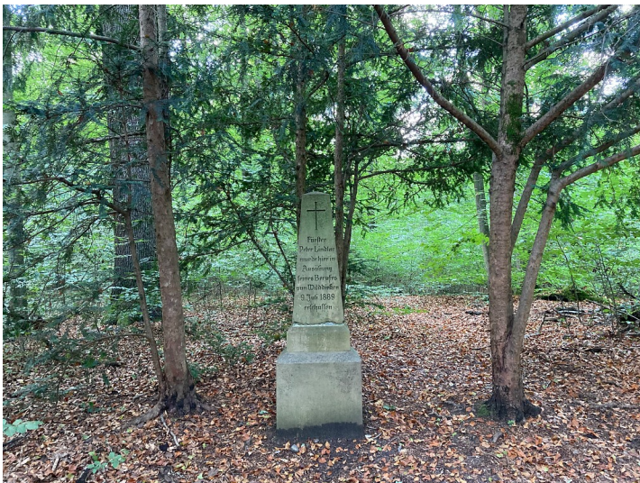
Denkmal für Förster Lindlar im Saaler Mühlenwald (2020)