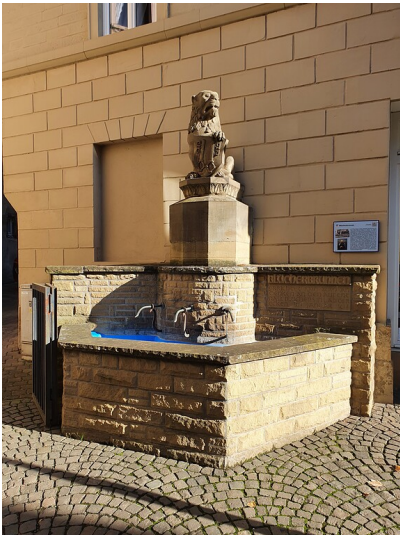
Blücherbrunnen in Lauterecken nach Neugestaltung 1982 (2020).