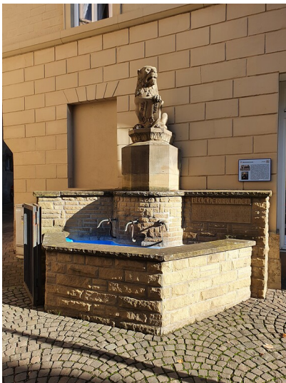
Blücherbrunnen in Lauterecken nach Neugestaltung 1982 (2020).