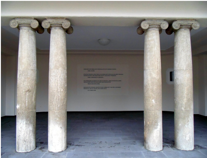
Vorgelagerte Säulen eines überdachten Raumes im Innenhof von Schloss Deichmannsaue (2020)