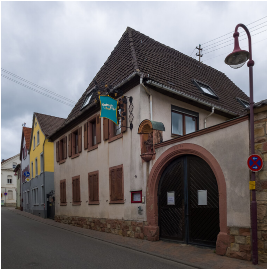
Vesperbild Hartmannstraße 14 Maikammer (2020)