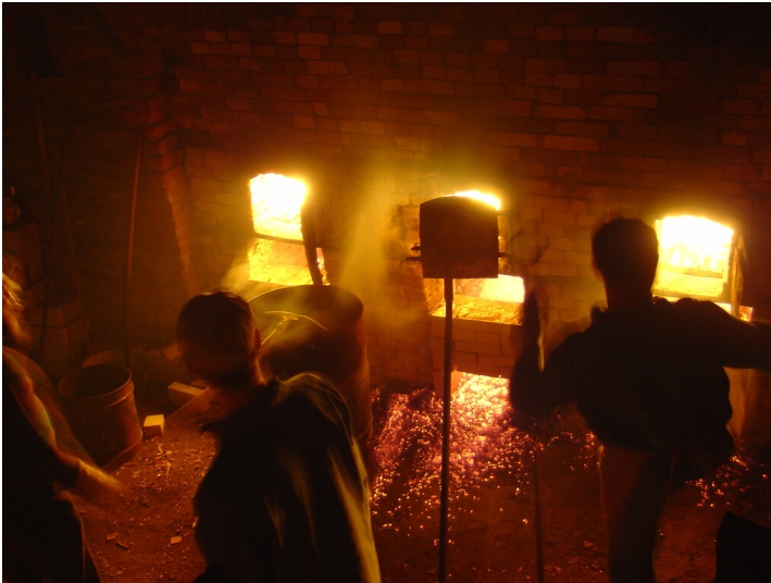
Kannofen Böhmer, die Feuerungen während des Großfeuers (2004)