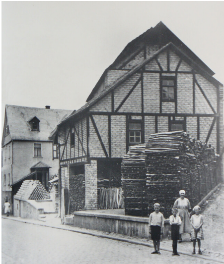
Eulerhof Menningen August 1932 (heutige Keramikwerkstatt Böhmer) (1932)