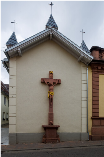
Steinkreuz Hartmannstraße Maikammer (2020)