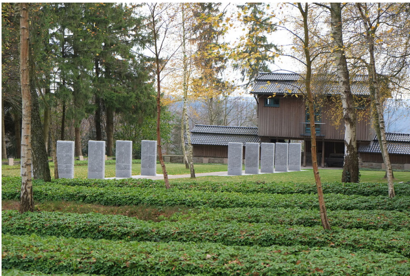
Bild 1: Blick von der Gräberstätte für sowjetische Zwangsarbeiterinnen und Zwangsarbeiter auf die Rückseite des Mehrzweckgebäudes am Eingang (2015).