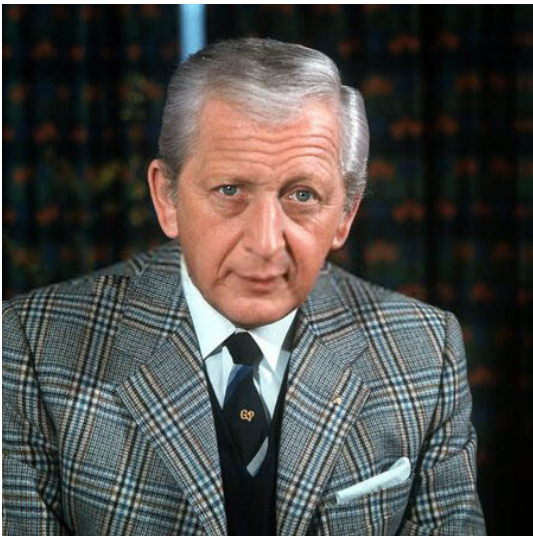
Der Schauspieler, Arzt und Rennfahrer Dr. Gunther Philipp (eigentlich Gunther Placheta, 1918-2003, Aufnahme von 1970).