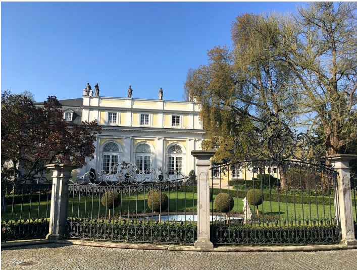
Die Redoute in Bonn-Bad Godesberg (2020)