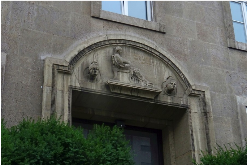
Die "kleine" Agrippina - Relief am Eingang Oppenheimstraße 4 in Köln Neustadt-Nord (2020)