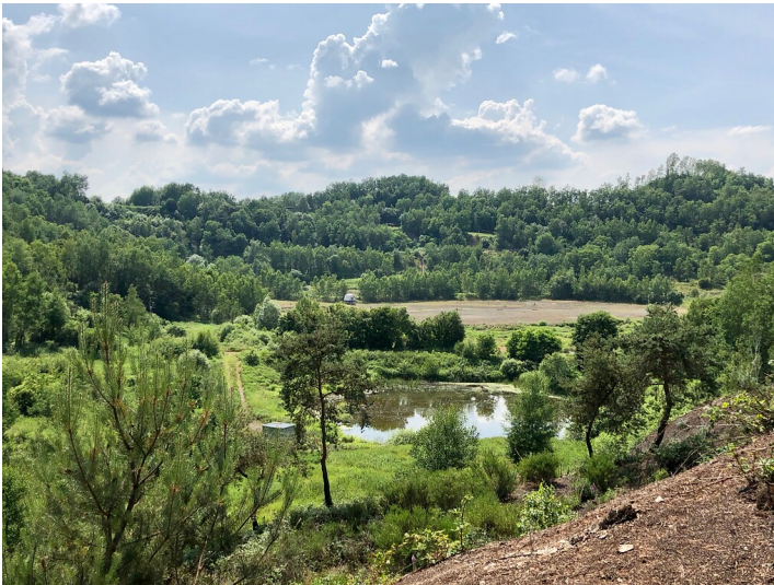
Die Grube Messel im Sommer (2018)