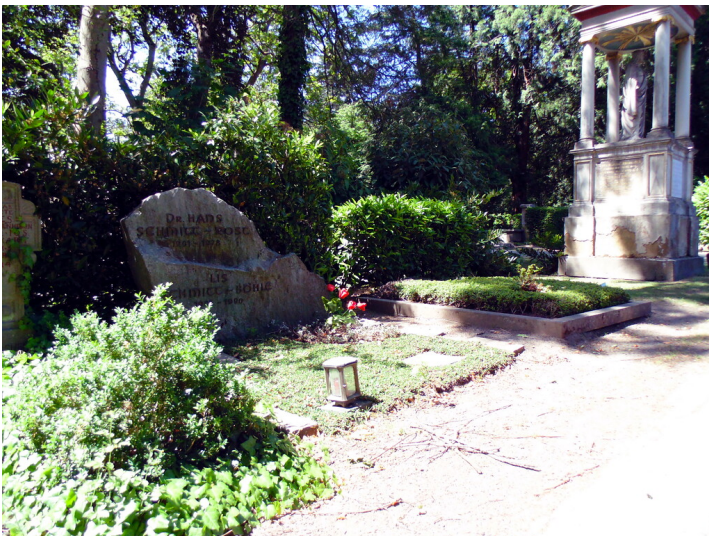
Das Grab der Kölner Mundartautorin Lis Böhle und ihres Gatten Hans Schmitt-Rost links im Vordergrund auf dem Melatenfriedhof in Köln-Lindenthal (2020).