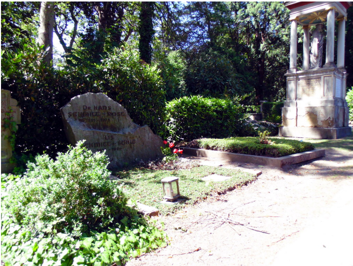
Das Grab der Kölner Mundartautorin Lis Böhle und ihres Gatten Hans Schmitt-Rost links im Vordergrund auf dem Melatenfriedhof in Köln-Lindenthal (2020).