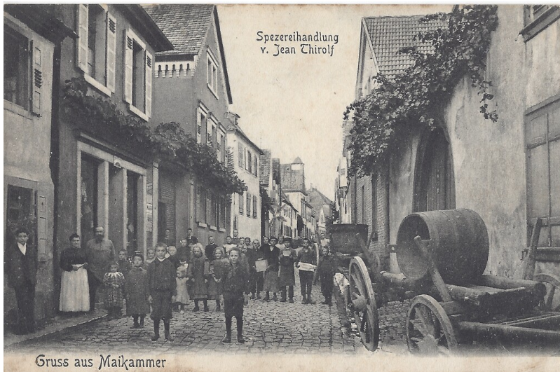
Hintergasse (Friedhofstraße) Maikammer (1915)