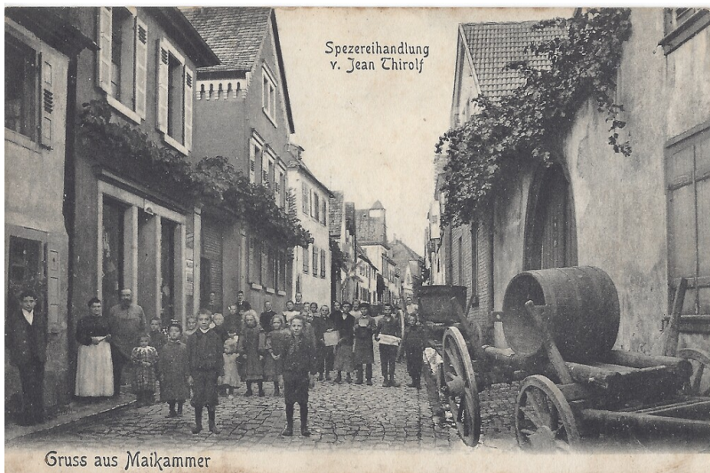
Hintergasse (Friedhofstraße) Maikammer (1915)