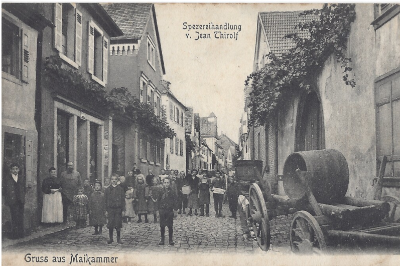
Hintergasse (Friedhofstraße) Maikammer (1915)